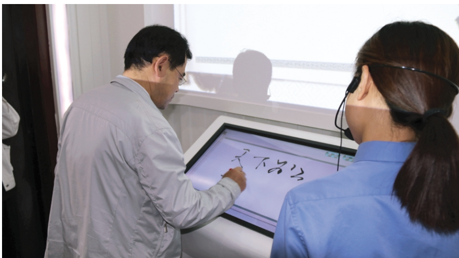
近日,资产管理公司党支部组织资产管理公司、格斯达担保公司全体党员干部职工赴赣榆区检察院廉政警示教育基地进行参观学习,接受廉政警示教育。参观后,广大党员干部纷纷表示,一定要认真遵守中央八项规定,加强“两学一做”学习教育,坚决反对“四风”,牢记党的宗旨,抵得住诱惑,永葆廉洁本色。(张明皓 李辛江)

今年以来,金桥制盐公司纪委持续发力,采取多种有效措施进一步加强和规范党内政治生活,切实让反腐倡廉成为党员干部的思想自觉和行动自觉,推进反“四风”工作抓常抓细。