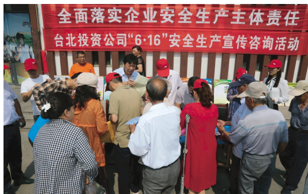
6月16日上午,台北投资公司在昌圩湖社区组织开展“6.16”安全生产宣传咨询活动,以宣传画册、发放传单、设置展板等多种形式,面向职工与社会公众集中宣传安全生产红线意识、法律法规知识和安全常识,并提供政策法规、职业卫生、应急救援、逃生自救等方面的咨询与服务。(韩挺)