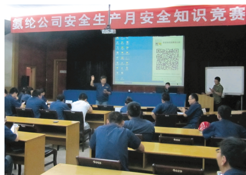
为落实安全生产责任制,改善安全生产技术水平和管理水平,增强企业职工的安全生产意识和自我保护意识,6月15日下午,氯纶公司安全部举办了安全生产知识竞赛活动。(氯纶宣)

召开一次“安全月”动员部署会,对“安全月”活动及相关工作进行总体部署和安排;开展一次宣传活动,通过标语、宣传栏、网站及现场咨询会等形式,广泛宣传安全生产方针政策、法律法规及安全科普知识等,结合开展“谈安全、话责任、抓落实”主题征文,营造浓厚的“安全月”活动氛围;开展一次“企业安全生产主体责任”宣传日活动,激励广大职工自查身边各类安全隐患,并针对重大隐患和严重“三违”行为设立举报奖;开展一次“安全生产知识”竞赛活动,突出“落实安全责任,推动依法治安,普及安全知识,提高安全素质”竞赛主题;开展“我为安全献一策”合理化建议征集活动,激励全体职工立足岗位看安全,结合时间出点子;开展一次“拉网式”安全隐患排查治理活动,规范使用“四表”排查法,突出分类排查,集中会办,限期整改,督查通报;开展一次安全警示教育,组织职工集中观看安全生产警示片,并围绕安全生产的重点领域、关键部位及薄弱环节进行座谈交流;开展一次应急预案演练活动,结合实际制定演练方案,提前落实演练人员、地点及工具等,提高应急处理能力;开展一次安全文化精品网上传播展活动,选择警示教育影视作品、展板挂图、公益广告和安全科普读物等安全文化精品进行网上传播展映,促进安全文化精品信息共享。(陈友春)