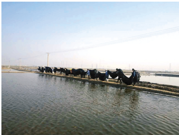
日前,徐圩西港服务区分会针对生产单元人少力弱工作现状,深入开展“单元互帮互助”帮扶活动,把各生产单元职工积极组织起来,互帮互助开展塑布安装、抢抓急难抗灾工程等工作,降低生产单元职工工作负荷,提高安全生产效率,为积极推进各项生产工作的有效开展提供措施保障。(戈美军)