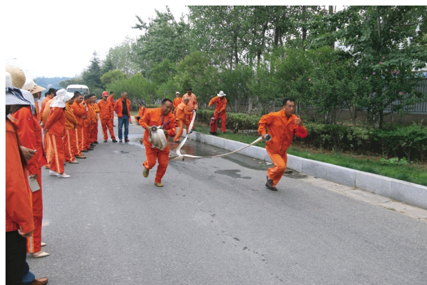
安全活动月开展以来,华茂绿化工程公司、神特公司等纷纷结合企业实际,组织开展各种消防演练活动。进一步增强了公司员工的消防安全意识,熟悉了消防抢险流程,完善消防应急预案。(陈炳辰 神特宣)