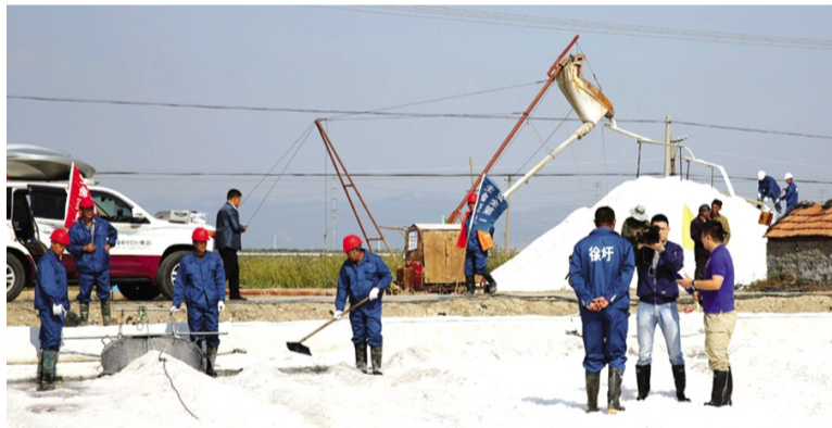
10月12日,江苏广播电视台总摄制组深入徐圩投资公司淮盐秋收现场和金桥制盐公司生产一线,隆重推出“走,赶海去”系列之淮盐篇现场直播节目,用淮盐“现场看”、“生产”、“盐工说”以及食用盐生产全过程展示的采访形式,再现改革开放以来,淮盐生产塑池新工艺40年的风雨历程。该节目网络直播一个小时,并在《江苏新时空》《新闻360》等栏目播出。(工宣 徐宣 金宣)

四季度,该公司将全力冲刺、务实举措,力争销售集团内盐1万吨、外购盐5.5万吨,供应煤炭2.5万吨;出口氯化钙5000吨,石榴子石1000吨;操作铬矿6000吨,预计全年营业收入1.2亿元,力争超额完成集团公司下达的各项目标任务。(王道武)