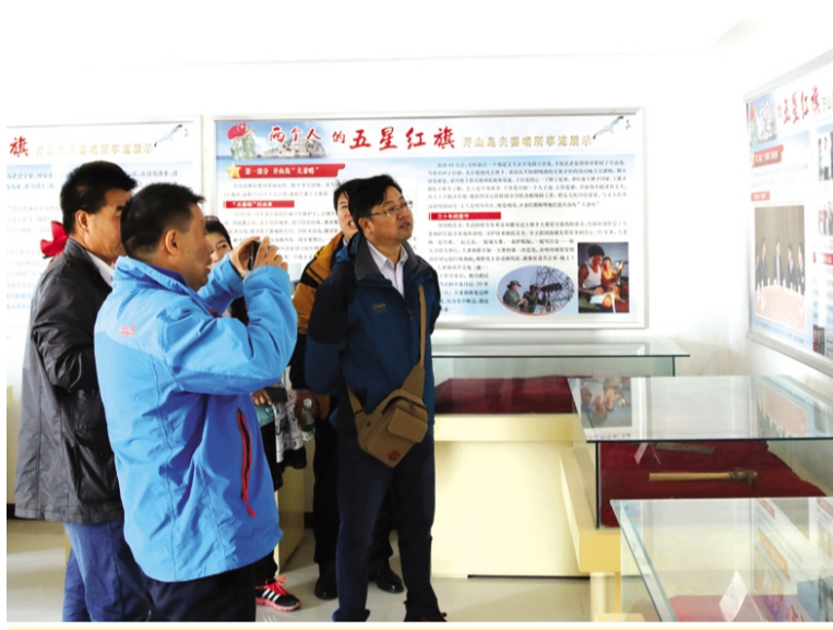
10月11日、15日,资产管理公司党支部、灌西西旺水产公司党支部分别组织部分党员、业务骨干赴灌云县开山岛,开展主题教育活动,进一步学习王继才同志先进事迹和崇高精神,努力做好大写的人、合格的共产党人、优秀的新时代国企人。(资产管理公司 许东彦)