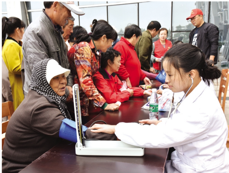
10月17日,徐圩投资公司开展“重阳节”敬老、爱老、助老系列活动。活动在“幸福家园”、“香河情缘”两个小区同时开展走访慰问、义诊咨询、理发、“秋冬养身健康小知识”宣传及扑克、象棋等文娱活动。(邵磊 茆莹)